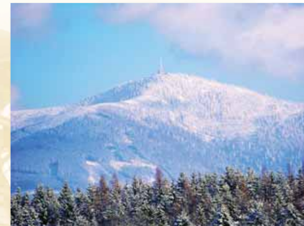
Lysá v zimě

Jak již zde bylo zmíněno, Bezruč byl vášnivým turistou. Podnikal dlouhé výlety po okolí, podle korespondence několikrát došel z Místku až do Těšína, což je asi 25 kilometrů. Jedna z jeho nejmilejších tras však byla na Lysou horu. Tato královna Moravskoslezských Beskyd se tyčí nad okolím jako výstražný prst a láká k výstupu. Bezruč zlákala několikrát a dodnes se na jeho počest koná každý rok tzv. „výplaz na Lysou“. Místní nadšenci tím vzdávají čest slavnému bardovi. Na vrcholu stála Bezručova chata, ta bohužel v roce 1978 vyhořela. V současné době se pracuje na obnově této památky.