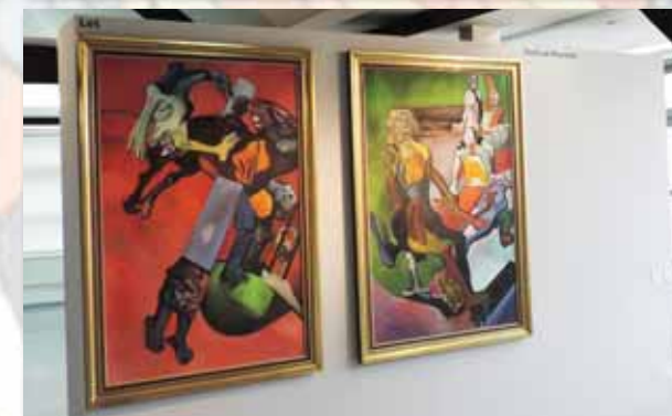
• Považská galéria umenia v Žiline, stála expozícia diel Vincenta Hložníka